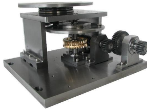
图 4 间歇回转工作台

(6002-2RZ)、推力球轴承(51120)、圆锥滚子轴承(30203)、轴用弹性挡圈等组成。详见图 4。