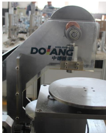
图 5 自动冲床机构

自动冲床机构由前后侧板，轴承座套、内外隔套、曲轴、活结轴、飞轮、冲头导向套，冲头、同步带轮等组成。该机构工作原理更贴近真实冲床结构，本机采用新型结构，具有结构简单、工作效率高的优点。详见图 5。