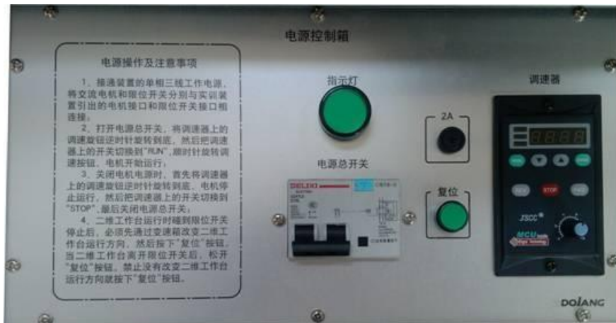
图 6 电源控制箱面板