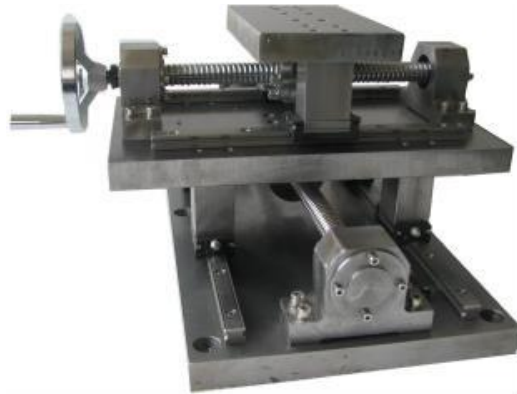
图 2 二维工作台