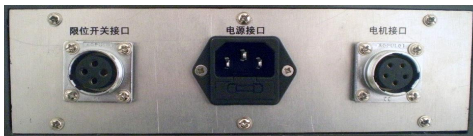
图 7 电源控制接口

如图 7 所示，“电源控制接口”面板装在实训工作台后面，为电源控制箱的输入输出接口。具体包括：