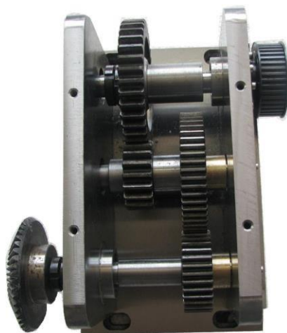
图 3 齿轮减速器

齿轮减速器由左右挡板、直齿圆柱齿轮、轴承座、输入轴、中间轴、输出轴、轴套、轴承闷盖、轴承透盖、轴承内隔圈、轴承外隔圈、上封盖、角接触轴承（7003AC）、深沟球轴承（6003-2RZ）、轴用弹性挡圈、齿轮减速器底座等组成。详见图 3。